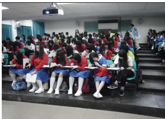
同學參加測試情形二