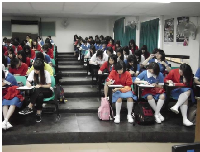
同學參加測試情形一