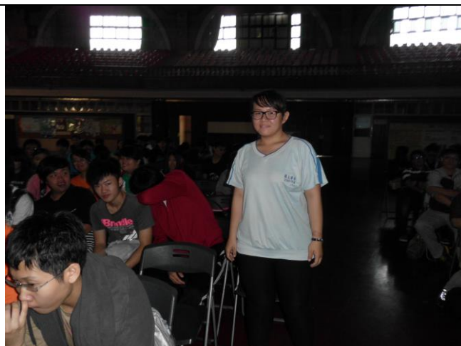
學生提教科書影印問題