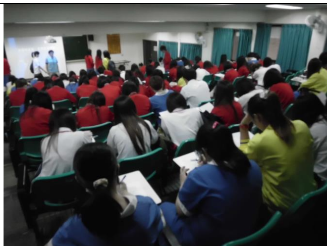
宣佈「智慧財產權」有獎徵答規則