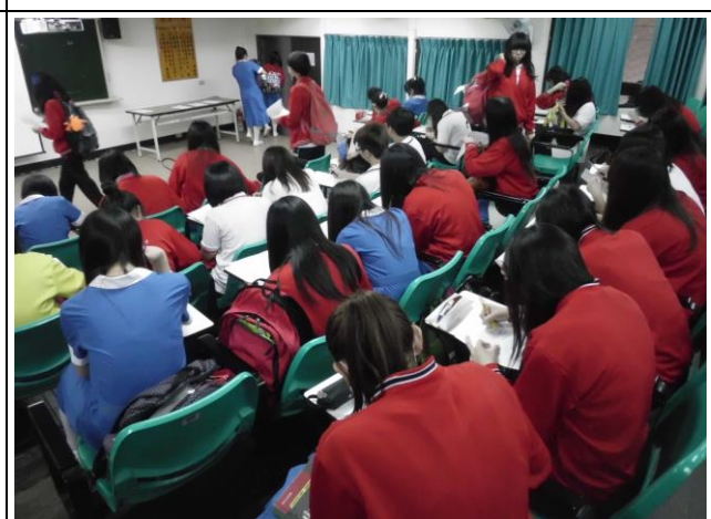
測驗完的同學繳交試卷情形