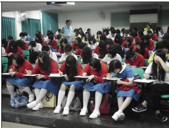
核對參加學生證件